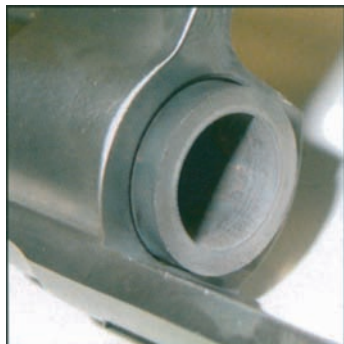
Før: Revolver pusset med et veldig kjent rengjøringsmiddel