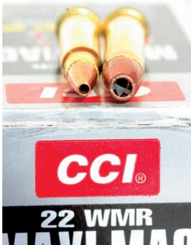
Det er forskjell på både hol og kulediameter på holspiss i 17 HMR og 22 WMR!

Men testrifla er den som er testa her – og den ER presis! Nokre femskotts-seriar på 100 meter måtte prøvast, og sjølvsgatt var ikkje femskottssamlingane like små som treskottssamlingane. Men Federal 50 grs HP enda på 20 mm.