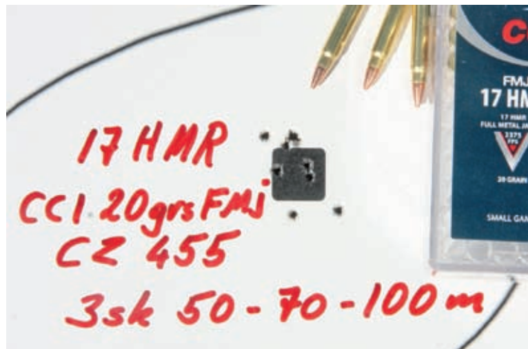
Flott niskotsamling med tre skot på 50 m, tre på 70 og tre skot på 100 m med CZ 455 17 HMR og CCI 20 grs FMJ!

17 HMR CCI 20 grs FMJ presterer gjennomsnitt på 16 mm, CCI 17 grs TNT HP 17 mm. Femskot på 100 meter gav 31 mm med CCI 20 grs FMJ og 36 mm for CCI 17 grs TNT. Fleire kommentarar om presisjon med 17 HMR løp i CZ 455 er vel overflødig? ●