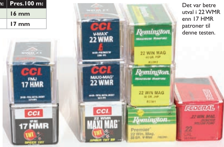
Det var betre utval i 22 WMR enn 17 HMR patroner til denne testen.