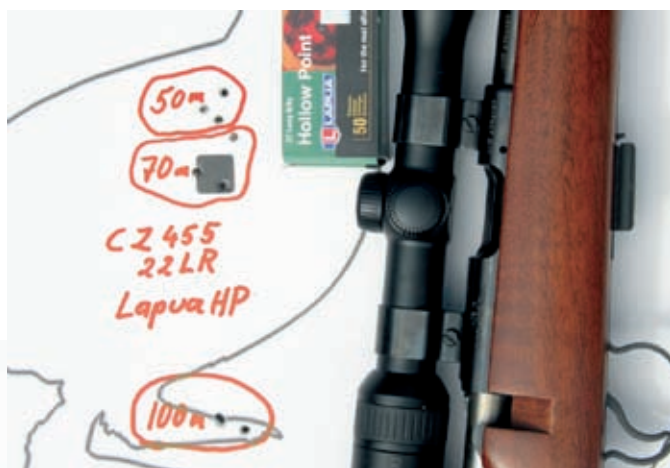
God presisjon med CZ 455 22 LR og Lapua HP, avstand frå øvste skot på 50 m til nedste på 100 m er 15 cm.